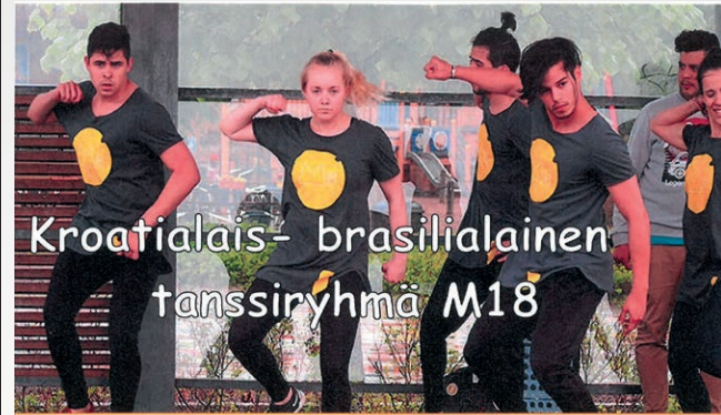
Kroatialais-brasilialainen tanssiryhmä M18

Su 19.5. klo 10 Messu kirkossa. Närhi, Niskala.