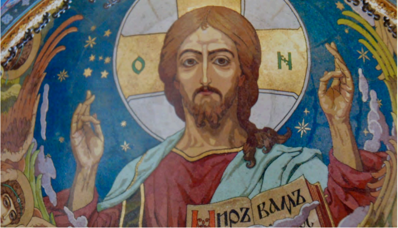
Rauhaa teille, toivottaa Kristus Pietarin Verikirkon kattokupolissa.