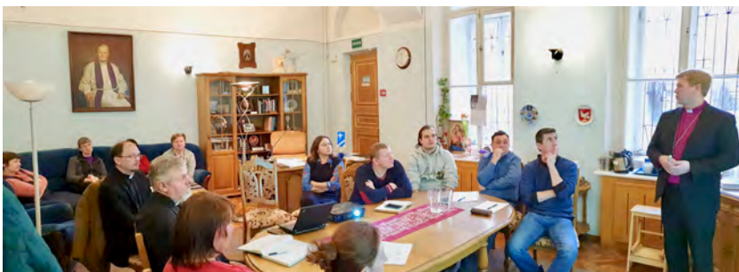
Keskuskanslian väki koolla piispan johdolla

Tätä kirjoittaessamme keskuskanslian ja Kelton teologisen Instituutin työ jatkuu ainakin vielä normaalisti. Hygieniaan tietysti kiinnitetään tavallista enemmän huomiota.