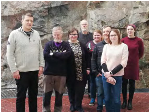
Ja Lilli sai kokoustamisen aikana valmiiksi kaksi paria villasukkia.

Juuri ennen poikkeustilalainsäädännön voimaantuloa, ehdimme pitää 11.-13.3. SEKLin Venäjän työalueen lähettien vuosikokouksen. Tämänkertainen kokouspaikka oli Siikaniemen kurssikeskus. Ihanissa maisemissa oli mukavaa hoitaa vuosikokousmuodollisuudet, rukoilla yhdessä ja ulkoilla. Hetki erilaisissa maisemissa tuntuu nyt jälkikäteen valmistautumiselta nykyiseen eristyskauteen.