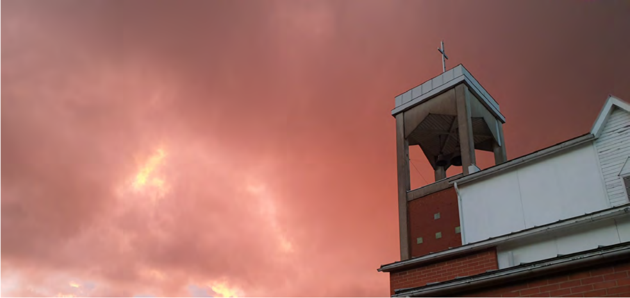
Kelton kirkko ja punoittava taivas