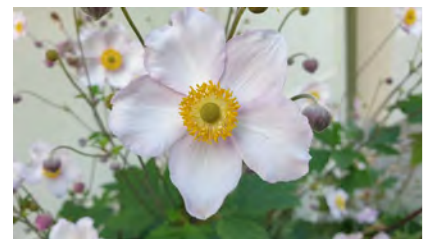
Helteistä huolimatta alkaa syksyn merkkejä vähitellen näkyä luonnossa. Wittenbergissä kukk näitä ihania syysvuokkoja ihan jalkakäytävilläkin