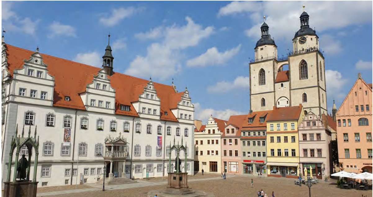
Näkymä Wittenbergin raatihuoneentorille. Tuossa kaksitornisessa kaupunginkirkossa Luther aikaan saarnasi.