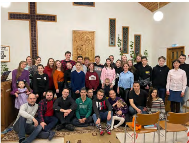
Samaisen leirin toisena vetäjänä olin vuonna 2000. Kylläpä aika rientää!

Joku teistä lukijoista ehkä muistaa, että suunnittelin tekeväni matkan Venäjälle tammikuun puolivälissä. Koronatilanne kuitenkin paheni niin, että reissu jäi tekemättä.