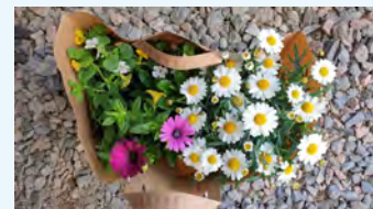
Ostimme kassillisen kesää.