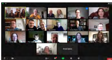
Virossa työskentelevien ja Virosta maailmalle lähteneiden lähettien tapaaminen.