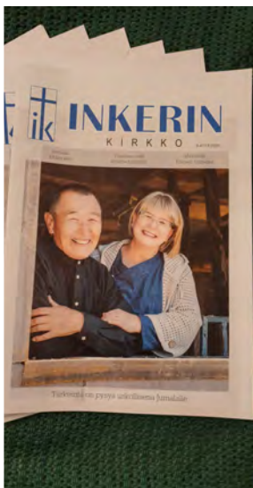
Tässä ihailtavaksi vielä edellisen lehden kansi.

Kun marraskuussa podin koronaa, niin maku- ja hajuaisti temppuilivat muutaman päivän. Sen jälkeen ne alkoivat taas toimia normaalisti ja tulini muutenkin kuntoon. Joulun alla kuitenkin aloin hetkittäin tuntemaan tupakansavun hajua. Kukaan taloudessamme ei polta eikä naapuristakaan puske hajuja. Hajuaisti oli siis alkanut uudestaan temppuilla. Asia ei varsinaisesti häirinnyt elämää, mutta tuntui kuitenkin ärsyttävältä. Tätä kirjoittaessani on onneksi kuitenkin menossa jo neljäs "savuton" päivä. Olisipa näin jatkossakin? Kiitollinen olen kaikesta huolimatta.