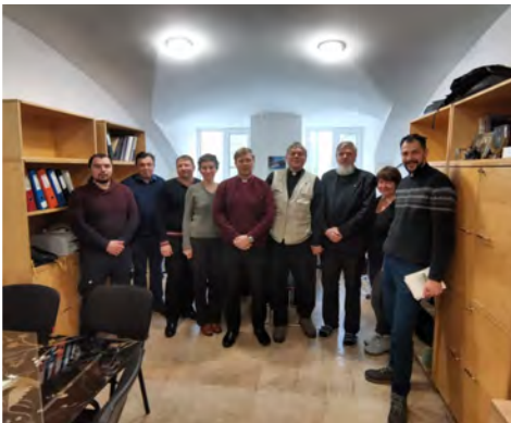
Keskuskansiaan väki uusissa tiloissa.

Ihana talvi jatkuu yhä edelleen, vaikka samalla päivien piteneminen muistuttaa lähenevästä keväästä. Monista aurinkoisista päivistä johtuen tuntuu, että voimatkin tässä ihan lisääntyvät. Sisälläni taitaa olla varaava aurinkopatteri.