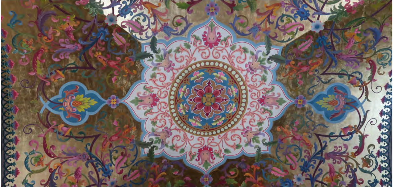
Tällaista kattoa voi ihailia Pietarissa A. Stieglitzin taideakatemiassa. Rajan pysyessä kiinni, pääsen onneksi käymään Pietarissa omia kuvia selaillen.