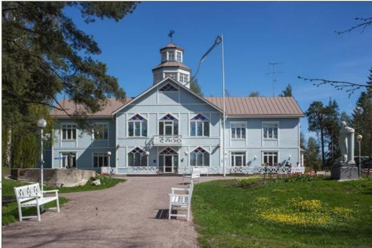
Nykyinen Syväranta valmistui 1990-luvun puolivälissä ja mukailee vuonna 1947 palanutta huvilaa.